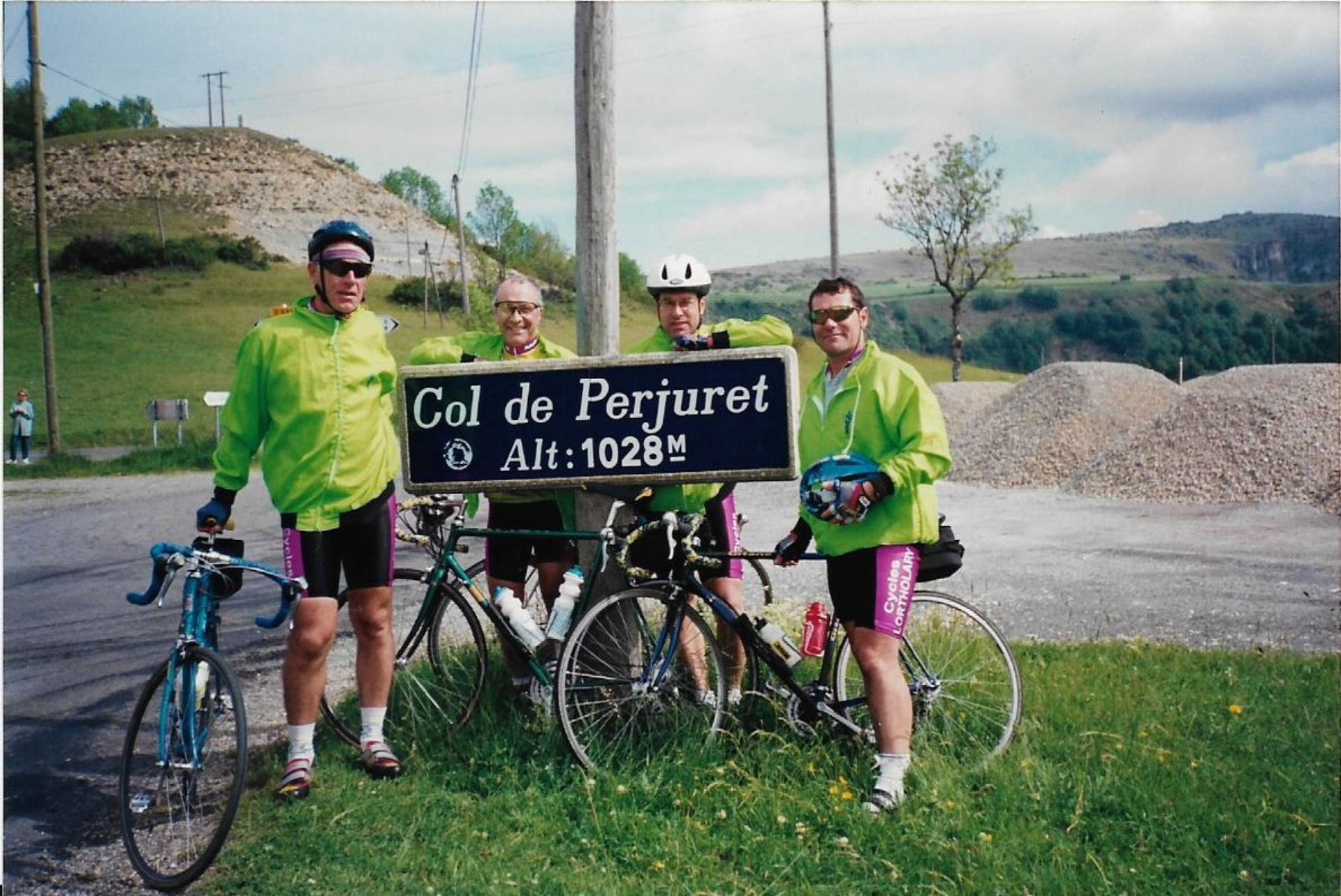
Mt Aigoual - 1997