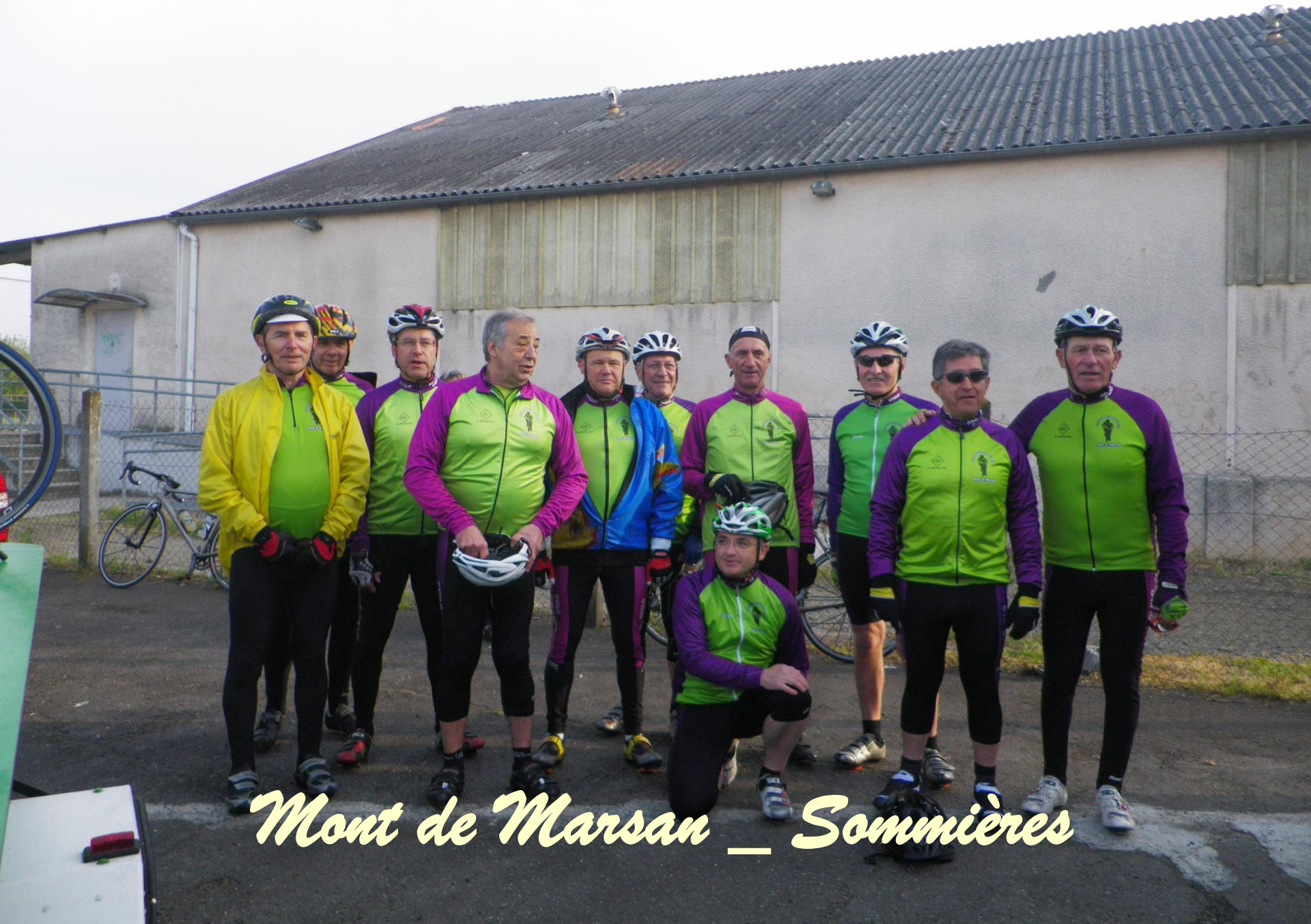
Mont de Marsan _ Sommières