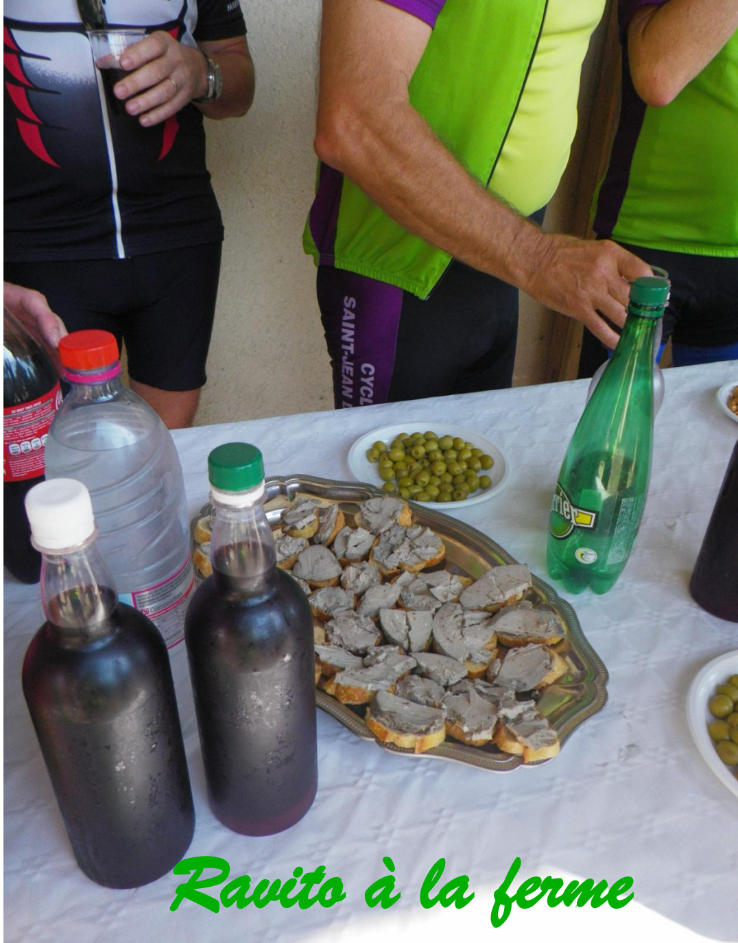
Ravito à la ferme