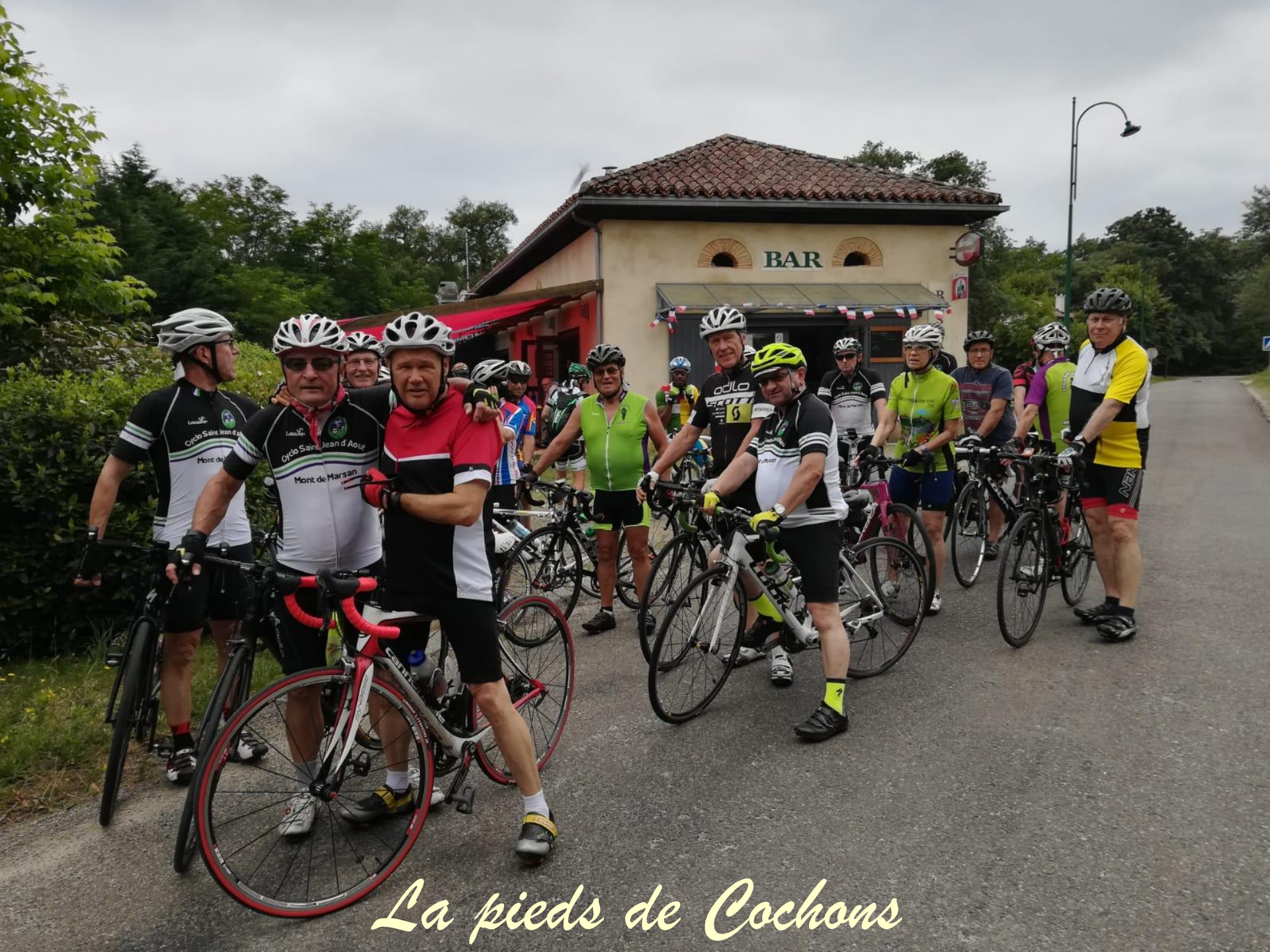
La pieds de Cochons