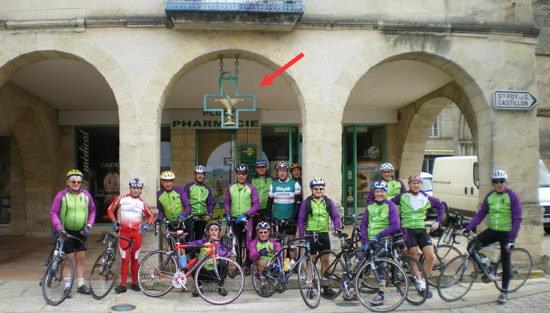
Langon « Ravitaillement »