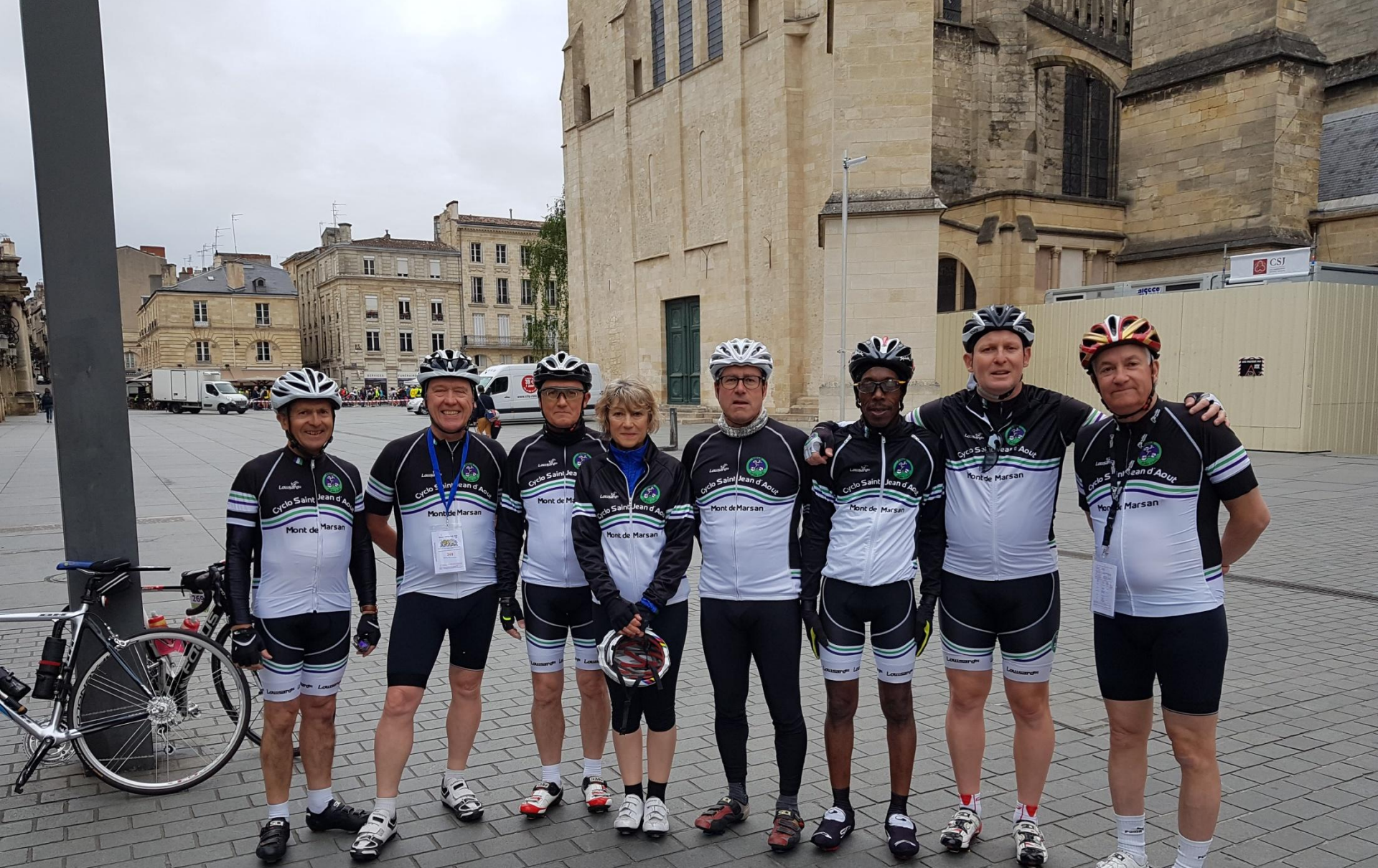
2018 - Bordeaux_Bilbao